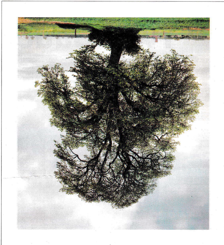
Napoleon Tree, 2003 c - print 21.75 x 20" edition 35 release price $2,500

Artists For Kids editions are published in partnership with Canadian artists in support of children, their art education and, their future.