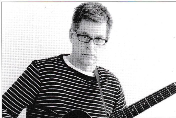
Artist/musician Rodney Graham is never far from his Gibson guitar.

The photograph "The Gifted Amateur (installation view)" is a production still which caught the eye of the artist as he created the set for his major lightbox work: "The Gifted Amateur" in 2007. It is a 'graham style' re-creation of a Morris Lewis inspired 1962 living room art studio. Rodney Graham's creation of elaborate sets have figured prominently in his work in recent years. Of special interest to Artists for Kids is the fact this work was built and photographed in the old Lonsdale school gym which is now the site of the new Artists for Kids Gallery in North Vancouver, BC.